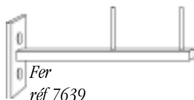
Fer réf 7639

Carré de 8x8 mm sur platine 20x4 de 52mm 2 trous fraisés Retour 5/10 = 1 gond de 40mm vissé à 10mm de l'extrémité Retour 12/15/20 = 2 gonds vissés à 10mm et 10 + 70 mm